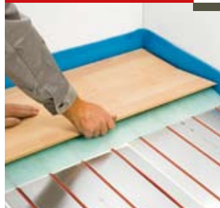
Installation du sol en bois

Poser le support sur les plaques T2Reflecta puis installer le nouveau sol en bois ou en stratifié conformément aux instructions du fabricant.