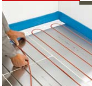
Installation du ruban chauffant

Introduire le ruban chauffant T2Red dans les rainures. La puissance souhaitée est déterminée par l'écartement des boucles du ruban.