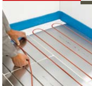
Pose du ruban chauffant

Introduire le ruban chauffant T2Red dans les rainures. La chaleur produite est déterminée par l'écartement entre les boucles du ruban. (100, 200 ou 300 mm).