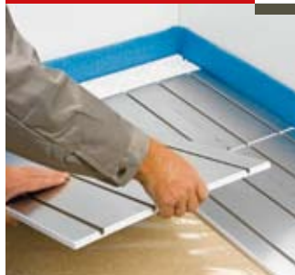
Pose des plaques

Installer les plaques T2Reflecta (sans colle) directement sur le support.