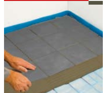
Pose du carrelage

Le carrelage se colle directement sur les plaques T2Reflecta conformément aux instructions des fabricants de colle. Vous pourrez profiter du confort de votre chauffage par le sol environ 24 heures après avoir fait les joints du carrelage.