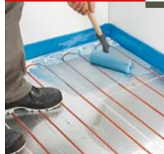
Application de primer au rouleau

Appliquer le primer T2Reflecta-P-FIX sur la couche d'aluminium.