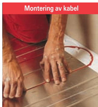
T2Red-varmekabelen festes i de ferdige sporene på platen. Hvor tett du legger kabelen avgjør hvilken effekt du får.