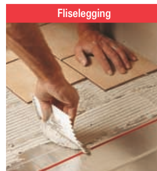
Legg flisene direkte oppå Reflecta-platene i samsvar med anvisningene. Etter omtrent 24 timer kan du kose deg med et godt og varmt gulv.

Se i de detaljerte monteringsanvisningene som følger med alle T2-produkter