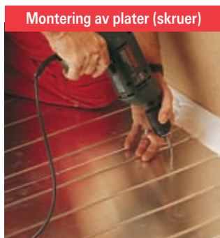
...eller skrues inn etter spesialanvisninger.