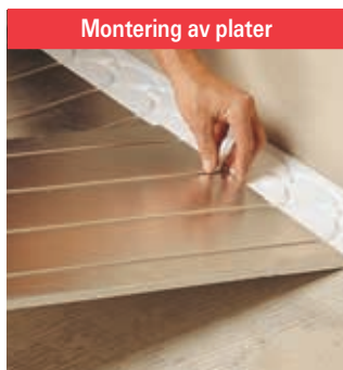
Reflecta-platene kan limes til gulvet undergulvet.